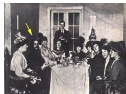
Rasputin (vedi freccia) durante un incontro con un gruppo di signore.

Per moltissimi anni la presenza di Rasputin a corte sarà vista come un'anomalia sopportabile da chi lo avversa e un motivo di interesse per chi ne subisce il fascino. Soprattutto le donne.