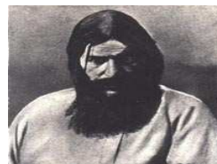
Il "monaco pazzo" che subornò la famiglia imperiale russa